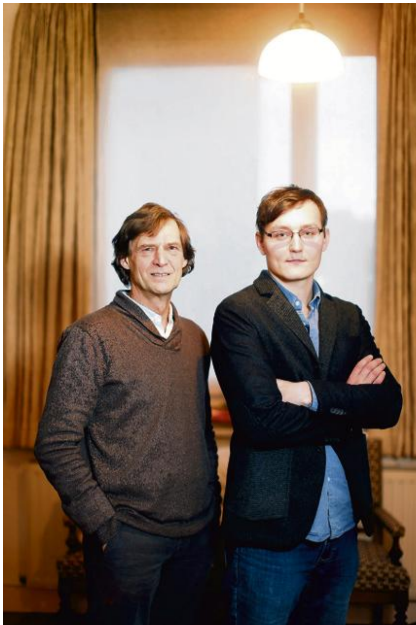
Met 'End credits' maakten Marc Cosyns en Alexander Decommere een stevige, pakkende documentaire over euthanasie.

Cosyns vaart een eigenzinnige koers in de wereld van de stervensbegeleiding. Want ook onder pleitbezorgers van euthanasie leven meningsverschillen. Zo fundamenteel dat hij, nochtans een overtuigd vrijzinnige, enige tijd terug zijn lidmaatschap van het